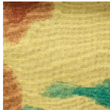
0562-03 BALI - NABIS