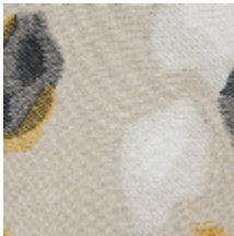
0562-02 BALI - COTON