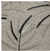
0570-04 MIMOSA - NATUREL