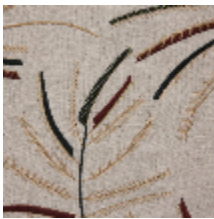
0570-03 MIMOSA - POUDRE