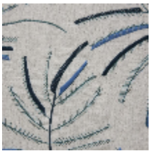
0570-01 MIMOSA - SANTORIN