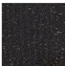
0571-03 CAMARGUE - FUSAIN