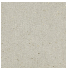
0571-01 CAMARGUE - CHAUX