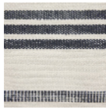
0573-04 MARINA - ORAGE