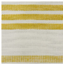
0573-02 MARINA - PASTIS