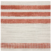
0573-01 MARINA - TERRACOTTA