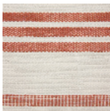
0573-01 MARINA - TERRACOTTA