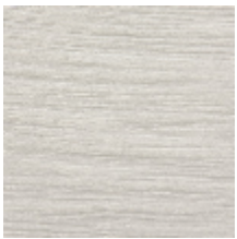
0575-01 RIVAGE - ECUME