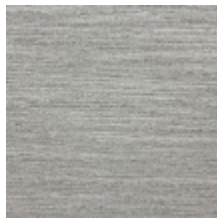
0575-03 RIVAGE - BRUME