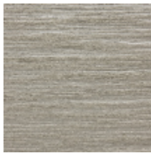
0575-02 RIVAGE - PIERRE