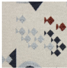
0578-03 REGATE - NAUTIQUE