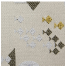
0578-02 REGATE - ZENITH