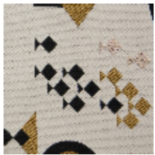
0578-01 REGATE - FLAMANT