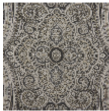
0582-03 PAISLEY - STEPPE