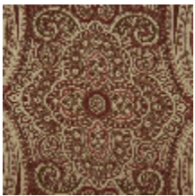
0582-01 PAISLEY - BOHEME