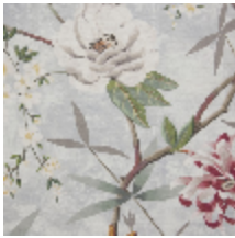
0583-02 PRINTEMPS DE CHINE - AQUA *