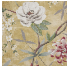
0583-01 PRINTEMPS DE CHINE - OR *