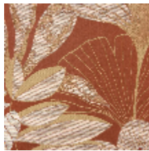
0609-03 HORTUS - SANTAL