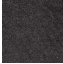
0616-28 SMART - CHARBON