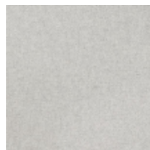
0616-23 SMART - PERLE