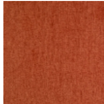
0616-34 SMART - TERRACOTTA