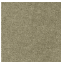
0616-20 SMART - AMANDE