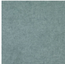
0616-31 SMART - JADE