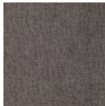
0616-46 SMART - TAUPE