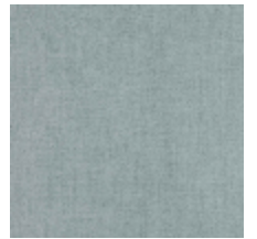
0616-42 SMART - CIEL