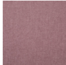
0616-35 SMART - PETALE