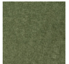
0616-18 SMART - ALOES