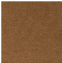
0616-14 SMART - HAVANE