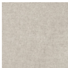
0616-21 SMART - DUNE