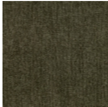
0616-32 SMART - KAKI