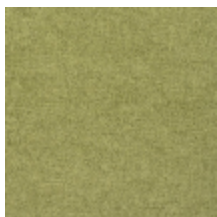
0616-19 SMART - PRAIRIE