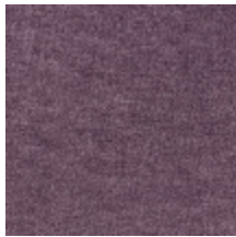
0616-08 SMART - AMETHYSTE