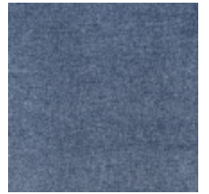
0616-06 SMART - MARIN