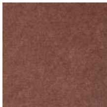
0616-13 SMART - AUTOMNE