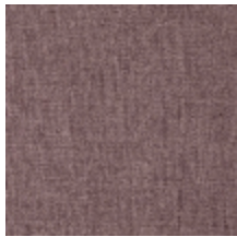
0616-37 SMART - TOURTERELLE