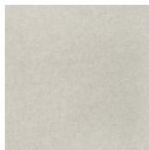
0616-22 SMART - NOUGAT