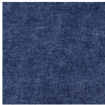
0616-07 SMART - INDIGO