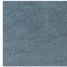
0616-05 SMART - ARCTIQUE