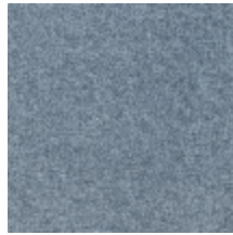
0616-04 SMART - JEAN