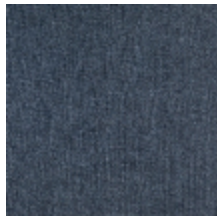
0616-39 SMART - PRUSSE