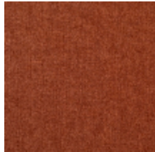
0616-33 SMART - ALEZAN