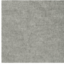
0616-25 SMART - PIERRE