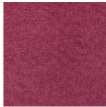
0616-10 SMART - PIVOINE