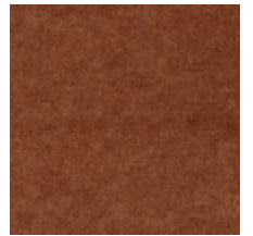
0616-12 SMART - SIENNE