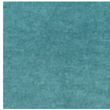
0616-03 SMART - TURQUOISE