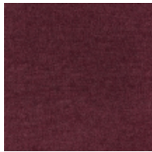
0616-09 SMART - BORDEAUX