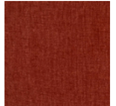
0616-36 SMART - CORNALINE