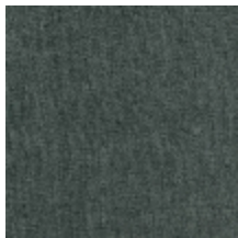
0616-43 SMART - EUCALYPTUS