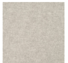
0616-24 SMART - FICELLE