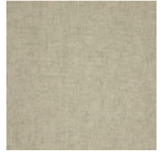
0616-30 SMART - VERVEINE