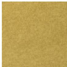
0616-15 SMART - MORDORE