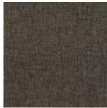
0616-40 SMART - ARDOISE