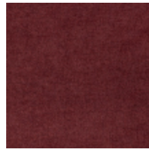
0616-11 SMART - BOURGOGNE