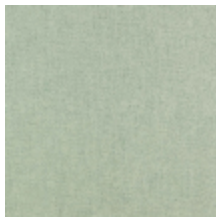
0616-44 SMART - CELADON