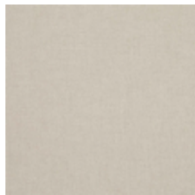
0616-45 SMART - ECRU