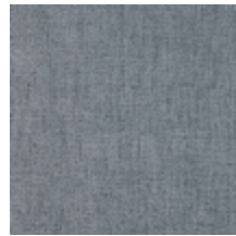
0616-41 SMART - BLEU ACIER