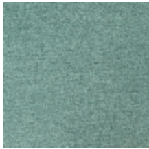
0616-01 SMART - LAGON