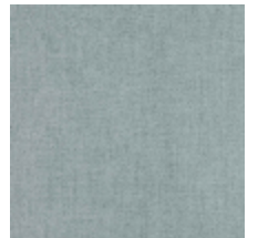
0616-42 SMART - CIEL