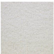
0625-01 KOSI - BLANC