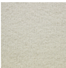
0625-02 KOSI - IVOIRE