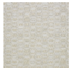
0630-06 KHAN - NACRE