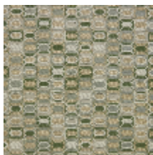
0630-02 KHAN - JADE