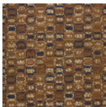
0630-01 KHAN - MORDORE