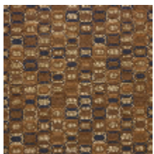
0630-01 KHAN - MORDORE