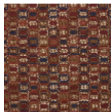
0630-04 KHAN - CORNALINE