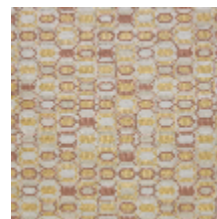
0630-05 KHAN - QUARTZ