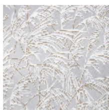
0637-02 GRAMINAE - GRIS *