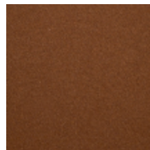
0638-23 TAÏGA - SAFRAN