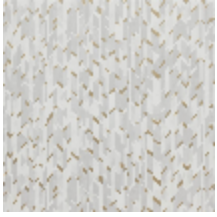
6445-01 MARQUETERIE MARBRE *