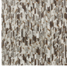
6445-02 MARQUETERIE BOIS *