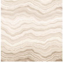
6446-01 CARRARE MARBRE