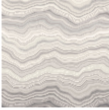
6446-02 CARRARE GRANIT