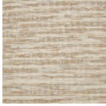
6459-01 REFLET - BEIGE ROSÉ