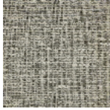
6459-03 REFLET - GRÈS