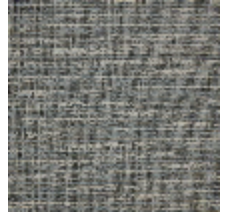
6459-06 REFLET - BLEUTÉ