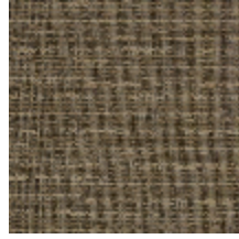
6459-05 REFLET - BRONZE