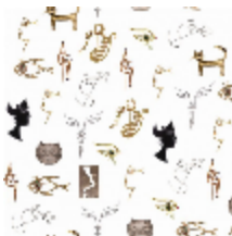
6463-02 JOYAUX - IVOIRE