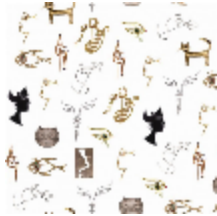
6463-02 JOYAUX - IVOIRE