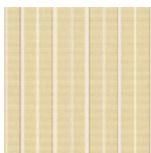
6498-01 RAYURE MLE - PAILLE