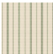
6498-02 RAYURE MLE - PRINTEMPS