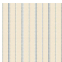
6498-03 RAYURE MLE - PORCELAINE