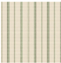
6498-02 RAYURE MLE - PRINTEMPS