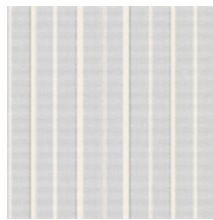
6498-04 RAYURE MLE - BLEUET