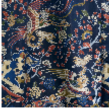
0650-02 LES REVERIES - INDIGO