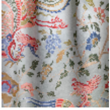
0650-01 LES REVERIES - CELADON