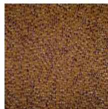
0652-05 KYRIELLE - AMBRE