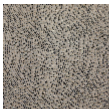
0652-09 KYRIELLE - GRAPHITE