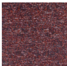
0652-07 KYRIELLE - FIGUE