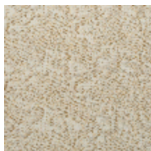
0652-03 KYRIELLE - DORE