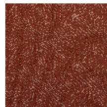
0652-06 KYRIELLE - TERRACOTTA