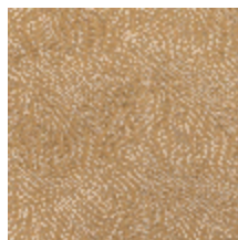
0652-04 KYRIELLE - MIEL