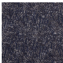
0652-08 KYRIELLE - INDIGO