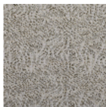
0652-10 KYRIELLE - JADE