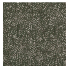
0652-11 KYRIELLE - CEDRE