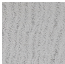
0652-01 KYRIELLE - ECUME