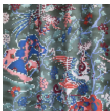
0653-03 LES SONGES - SAUGE