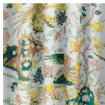
0653-01 LES SONGES - POUDRE