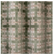
0655-01 LACIS - CELADON