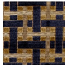
0655-05 LACIS - INDIGO