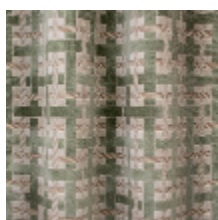
0655-01 LACIS - CELADON