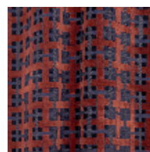
0655-06 LACIS - ACAJOU