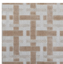
0655-03 LACIS - NATUREL