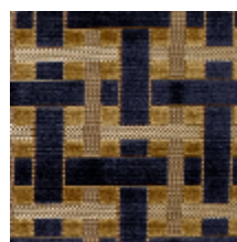
0655-05 LACIS - INDIGO