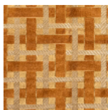
0655-04 LACIS - AMBRE