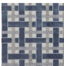
0655-02 LACIS - BLEUET