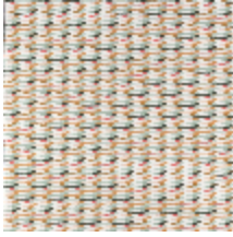
6596-02 TAPIS PLUMETTE CELADON