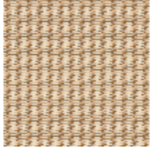
6596-01 TAPIS PLUMETTE NATUREL