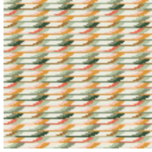
6597-01 TAPIS PLUMAGE NATUREL