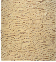
6637-02 TAPIS ONDES DUNE