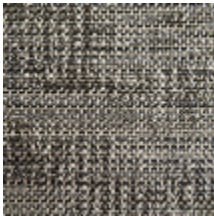
0746-02 MANGROVE MI - ARDOISE