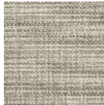
0746-04 MANGROVE MI - FICELLE