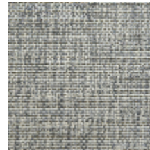
0746-05 MANGROVE MI - GIVRE