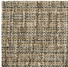
0746-01 MANGROVE MI - CAMEL