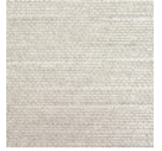
0750-06 COCOA MI - COCO