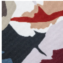
0752-03 PALMA MI - FAISAN