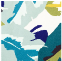
0752-01 PALMA MI - PAON