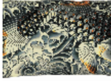
7613-01 COUSSIN SUBLIMATION BENGAL