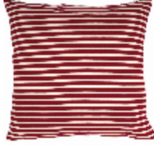
7624-01 COUSSIN MARINIÈRE ECRU/BLEU *