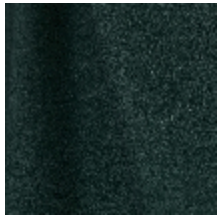
0795-13 DANDY - SAPIN