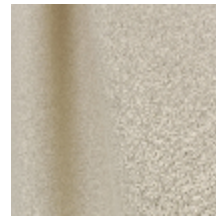
0795-24 DANDY - SABLE