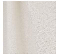
0795-25 DANDY - IVOIRE