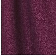
0795-01 DANDY - BORDEAUX