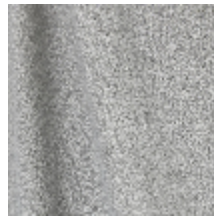
0795-23 DANDY - SILEX