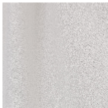
0795-26 DANDY - CRAIE