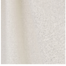
0795-25 DANDY M1 - IVOIRE