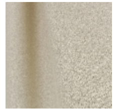
0795-24 DANDY M1 - SABLE