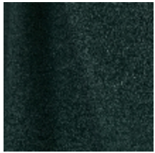
0795-13 DANDY M1 - SAPIN