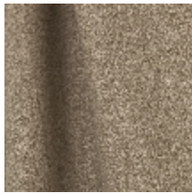
0795-20 DANDY M1 - DUNE