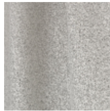
0795-22 DANDY M1 - GALET