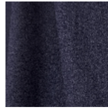
0795-17 DANDY M1 - MARINE