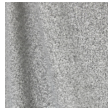
0795-23 DANDY M1 - SILEX