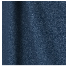
0795-15 DANDY M1 - PETROLE