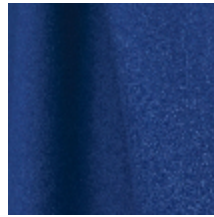
0795-16 DANDY M1 - COBALT