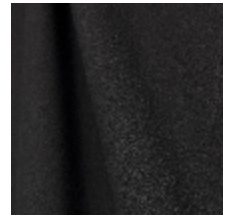
0795-18 DANDY M1 - CHARBON