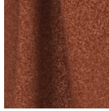
0795-04 DANDY M1 - TERRACOTTA