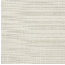
0796-01 PANAMA - CRAIE