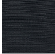
0796-05 PANAMA M1 - ARDOISE