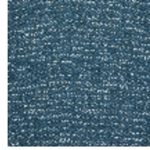
0798-05 TWEED - CANARD