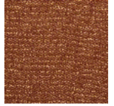
0798-06 TWEED - BRIQUE