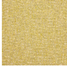
0798-03 TWEED - PEPITE