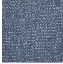
0798-04 TWEED - OCEAN