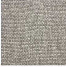
0798-02 TWEED - GRES