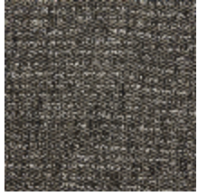
0798-01 TWEED - POIVRE