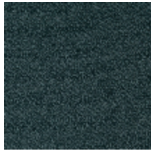
0802-03 LAGO M1 - AZUR