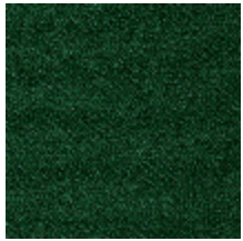
0802-01 LAGO M1 - CANARD