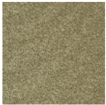
0802-07 LAGO M1 - LIN