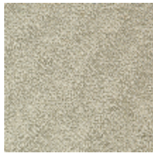
0802-09 LAGO M1 - CHANVRE