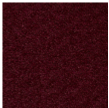
0802-13 LAGO M1 - BORDEAUX