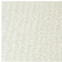
0802-08 LAGO M1 - NEIGE