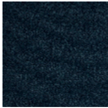
0802-02 LAGO M1 - NUIT