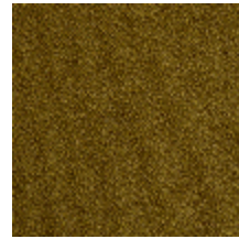
0802-05 LAGO - MOUTARDE