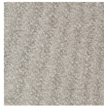
0802-10 LAGO - TOURTERELLE