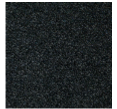
0802-12 LAGO - CHARBON