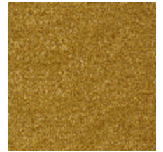
0802-06 LAGO - CURCUMA