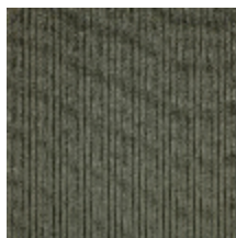
0806-21 RIGA M1 - ALUMINIUM