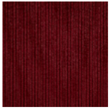
0806-13 RIGA M1 - THEATRE