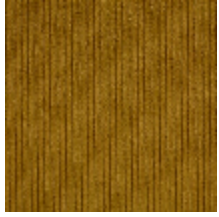
0806-01 RIGA M1 - CURRY