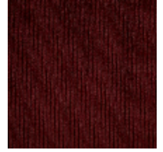
0806-06 RIGA M1 - BORDEAUX