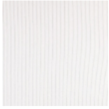
0806-25 RIGA M1 - CRAIE