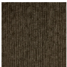
0806-19 RIGA M1 - VISON