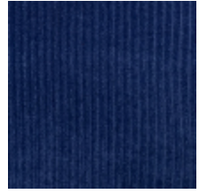
0806-30 RIGA M1 - OUTREMER