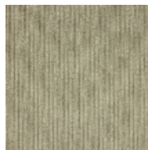
0806-22 RIGA M1 - GALET