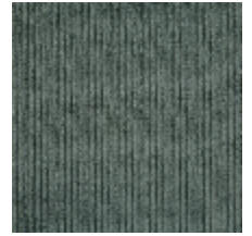
0806-12 RIGA M1 - ARDOISE