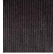
0806-29 RIGA M1 - TRUFFE