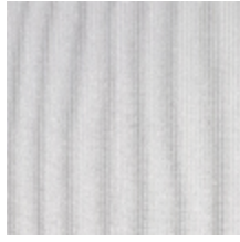
0806-27 RIGA M1 - BRUME