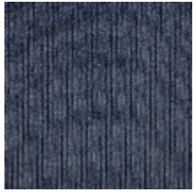
0806-07 RIGA M1 - IRIS