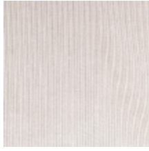
0806-26 RIGA M1 - KRAFT