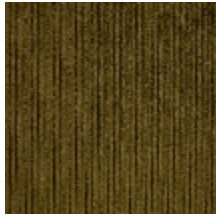
0806-08 RIGA M1 - KAKI