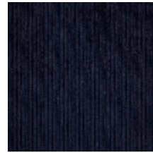
0806-17 RIGA M1 - MARINE