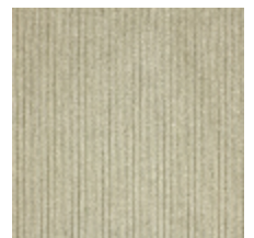
0806-24 RIGA M1 - ALBATRE