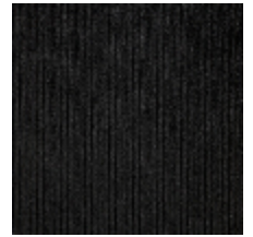
0806-18 RIGA M1 - NOIR