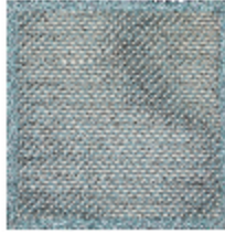
8601-04 TAPIS AMURE CIEL