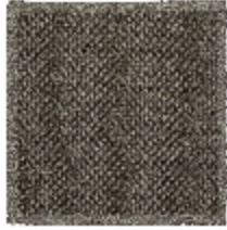
8601-03 TAPIS AMURE CENDRE