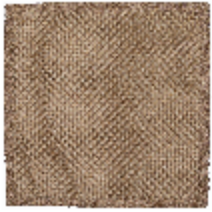
8601-01 TAPIS AMURE LIN