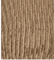
8601-02 TAPIS AMURE CAMEL