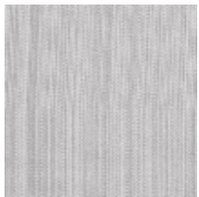
1682-15 VERTIGE - ARGENT