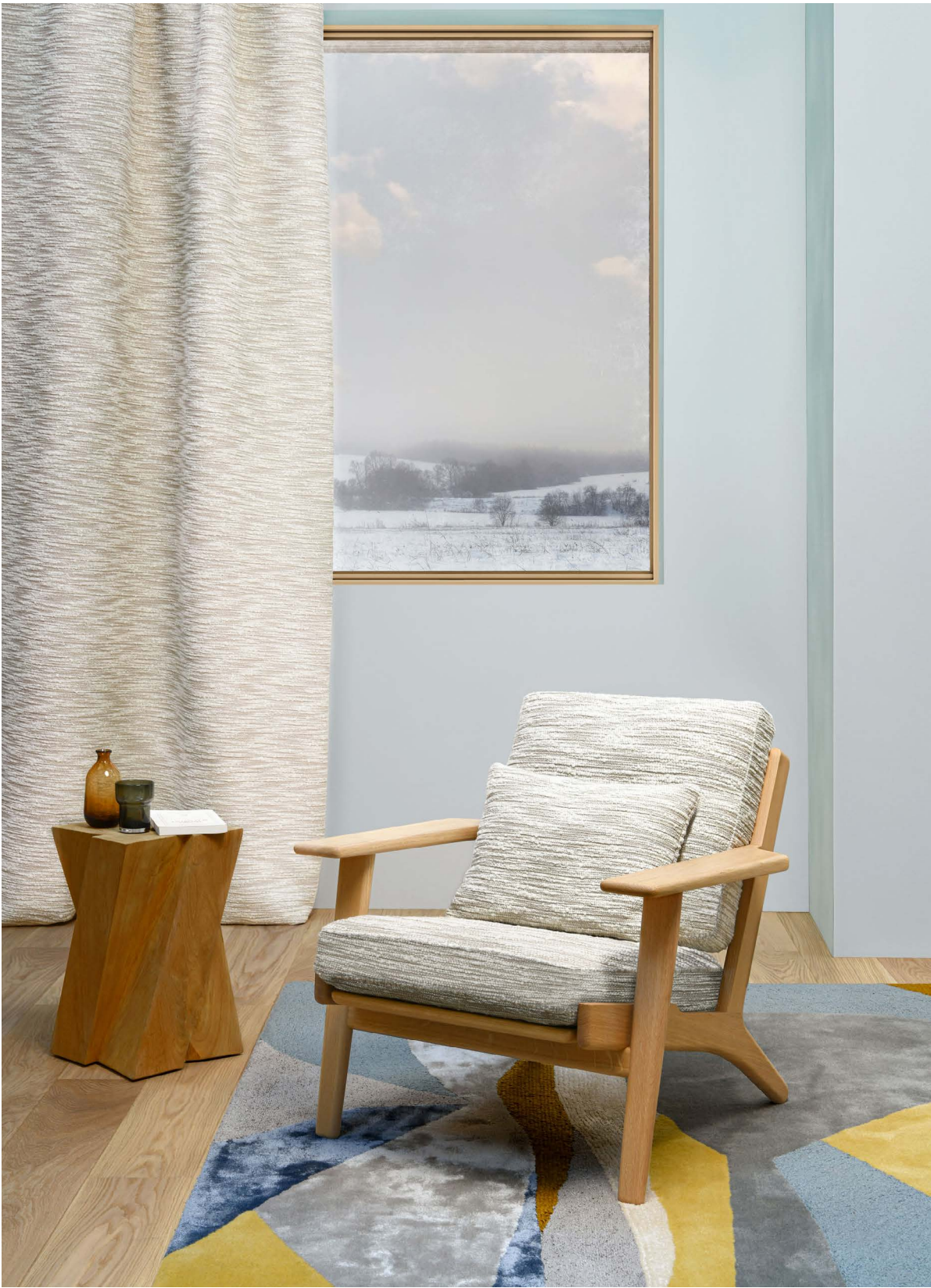
FAUTEUIL* Getama GE 290 TABLE BASSE Sutherland Zigi

1 coloris Naturel (636-01) Largeur laize 136cm | Poids (gr/ml) 1 379 gr/ml | Composition LI 47% WV 28% CO 24% PA 1% Prix 189.20 € TTC