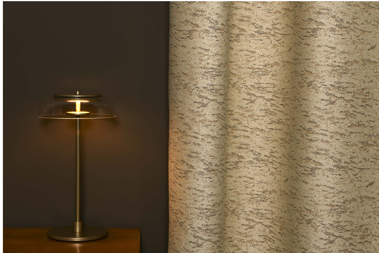
BUREAU Design Market Bureau Danois Ejning Møbler 1960