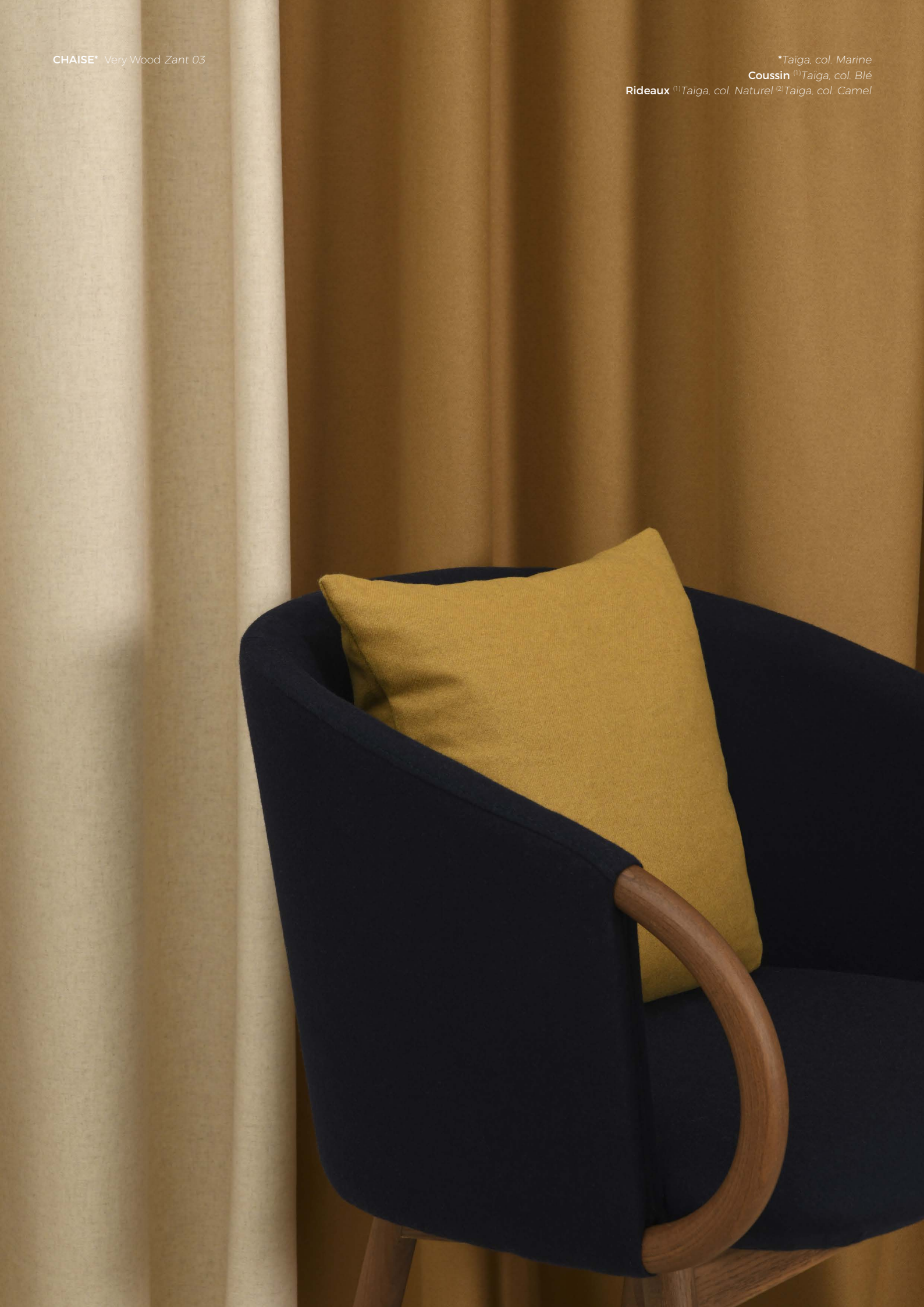
CHAISE* Very Wood Zant 03

23 coloris Naturel (638-01) Ecu (638-02) Neige (638-03) Perle (638-04) Brume (638-05) Chartreux (638-06) Fusain (638-07) Vison (638-08) Ours (638-09) Chamois (638-10) Camel (638-11) Blé (638-12) Anis (638-13) Forêt (638-14) Kaki (638-15) Cèdre (638-16) Sauge (638-17) Azur (638-18) Denim (638-19) Marine (638-20) Aubergine (638-21) Piment (638-22) Safran (638-23) Largeur laize 154cm | Poids (gr/ml) 420 gr/ml Composition WO 80% PA 20% | Prix 118.80 € TTC