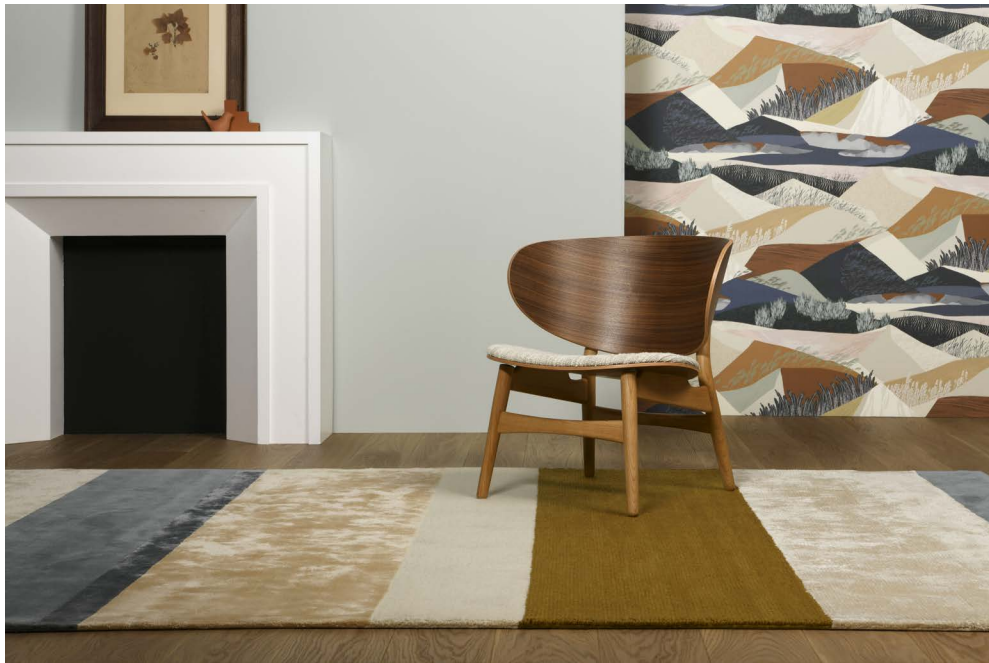
FAUTEUIL Getama, Hans J. Wegner, GE 1936 PEINTURE Mercadier col. CRASSULA