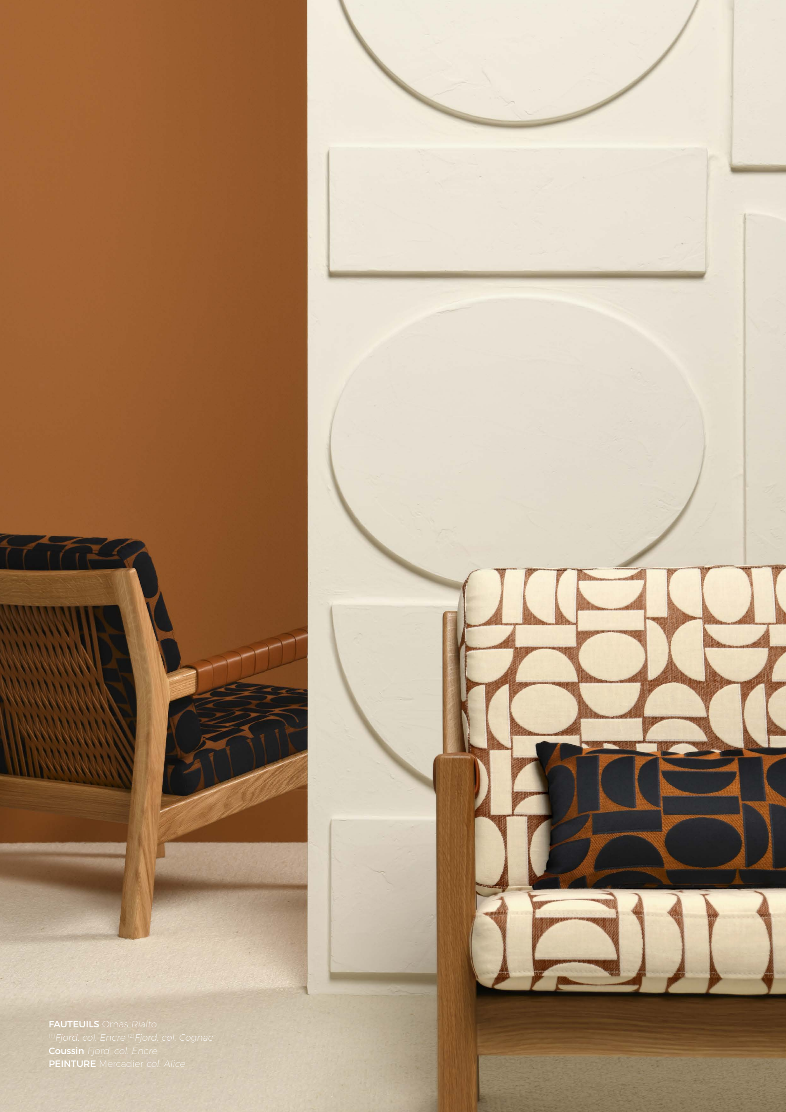
FAUTEUILS Ornas Rialto 1) Fjord , col. Encre 2) Fjord , col. Cognac Coussin Fjord , col. Encre PEINTURE Mercadier col. Alice

6 coloris Ecrû (4260-01) Glacier (4260-02) Céladon (4260-03) Cognac (4260-04) Encre (4260-05) Poivre (4260-06) Largeur laize 144cm | Raccord H 34cm x l 36cm | Raccord Droit | Poids (gr/ml) 625 gr/ml Composition CO 48% LI 43% PA 9% | Prix 147.40 € TTC Fabriqué en France