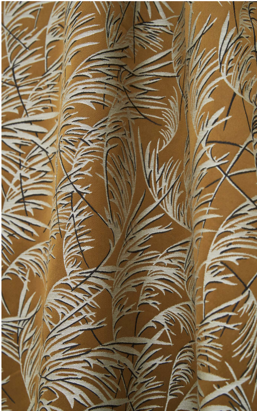
Rideaux Graminae , col. Gazelle