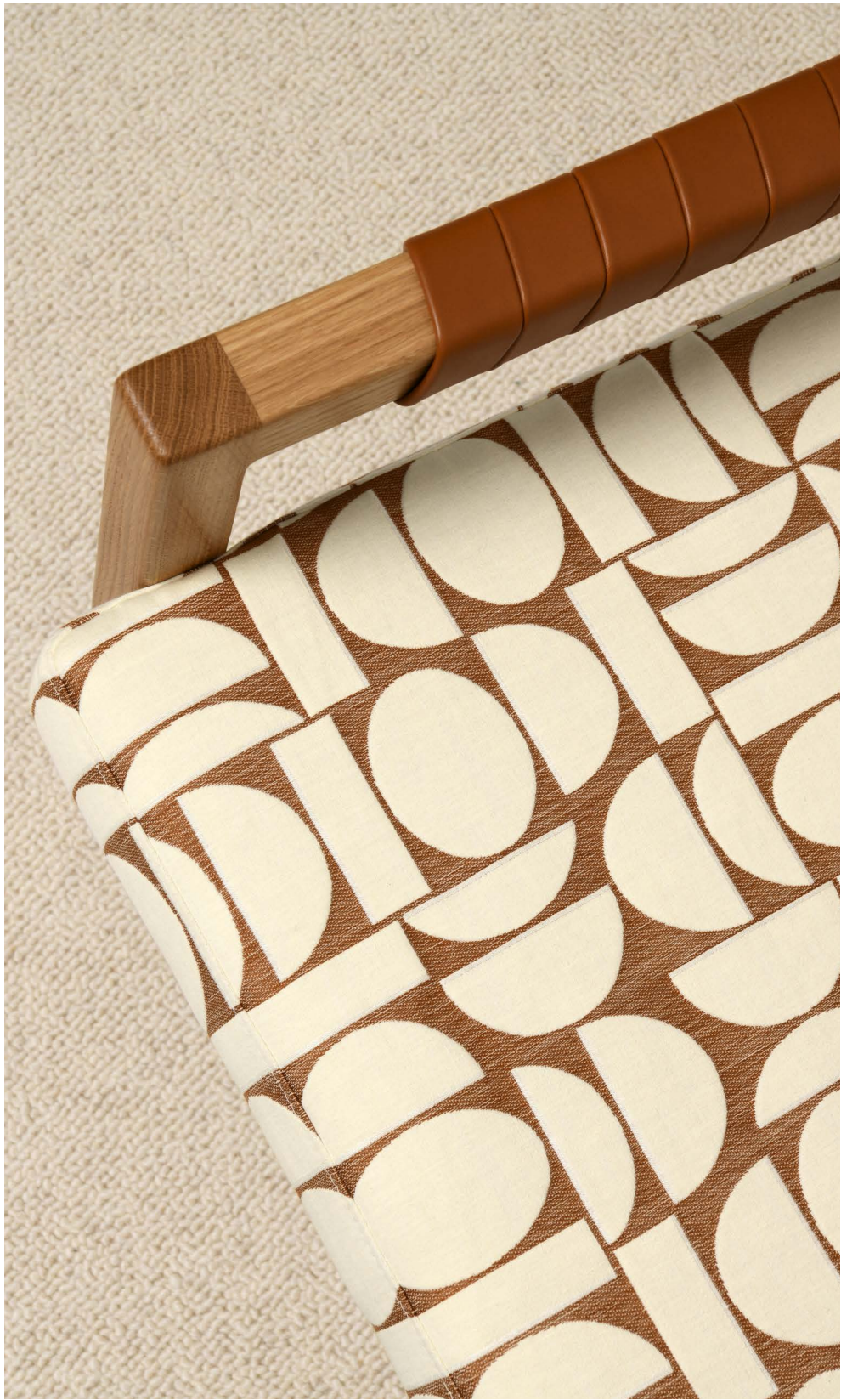
FAUTEUILS Ornas Rialto (1) Fjord, col. Cognac