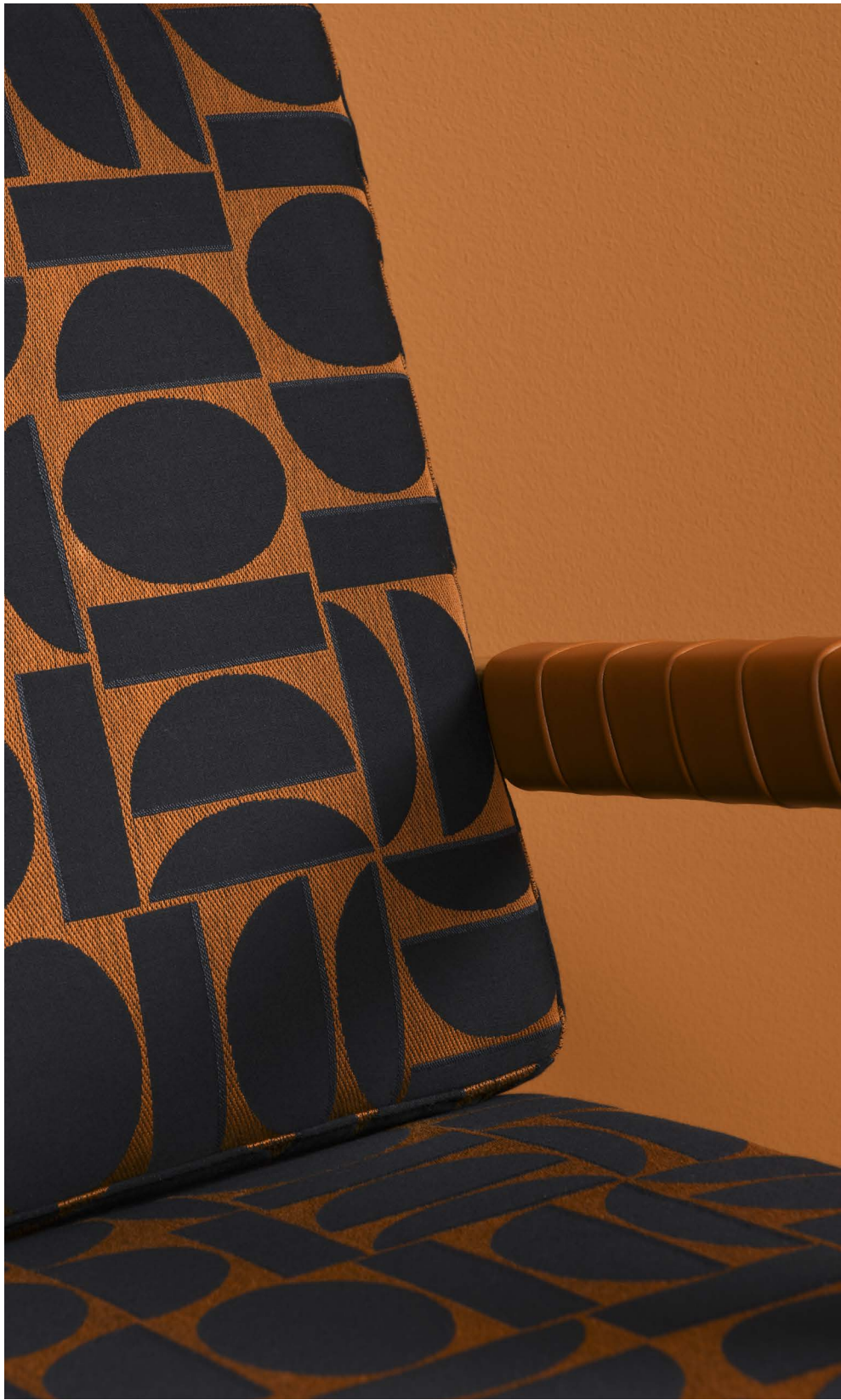
FAUTEUILS Ornas Rialto (1) Fjord, col. Encre PEINTURE Mercadier col. ALICE