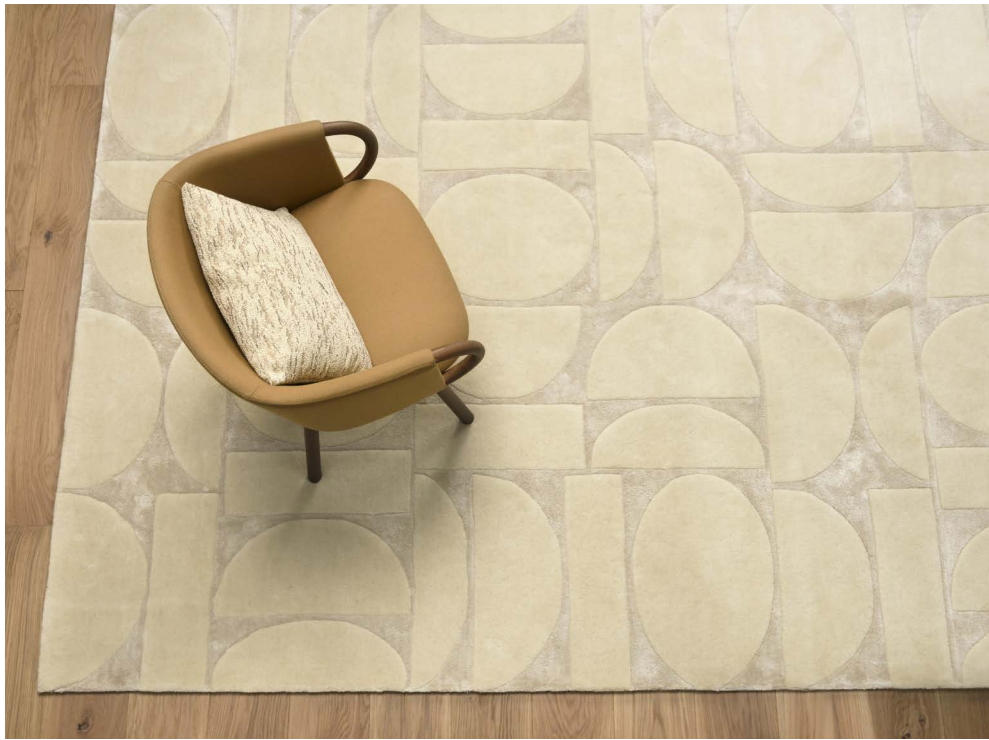
CHAISE Very Wood Zant 03 Coussin Baltic, col. Sable