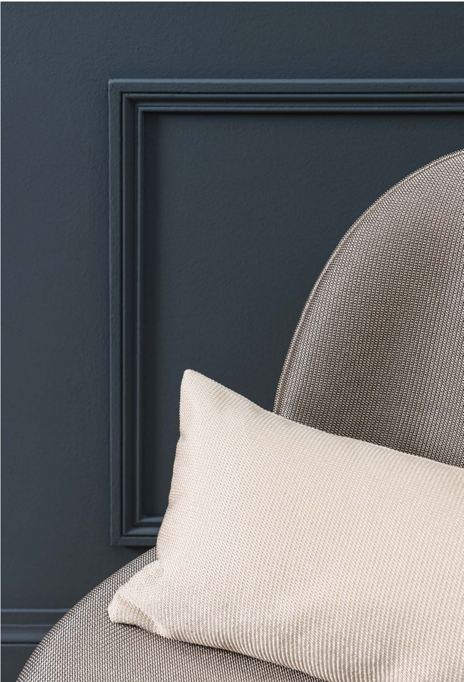
Ce cahier présente l’atmosphère des collections Lelièvre Paris, les coloris ne sont pas contractuels. 01-2021

Depuis plus de cent ans, Lelièvre Paris s’inspire et inspire. Des plus beaux châteaux aux appartements haussmanniens, des palais italiens aux cimes de l’Himalaya, Lelièvre Paris est une maison rayonnante et moderne. Elle propose aux professionnels de la décoration une collection de plus de 6000 références, composée de tissus, papiers peints, revêtements muraux, tapis et accessoires pour habiller les plus beaux intérieurs du monde dans une recherche permanente d’harmonie et d’élégance. Acteur incontournable de la décoration d’intérieur Lelièvre Paris est une des rares maisons capable de répondre à toutes les attentes de ses clients. Véritable créateur de tendance, Lelièvre Paris propose des designs audacieux et toujours fidèles à ce « je ne sais quoi » français qui les rend chics et intemporels.