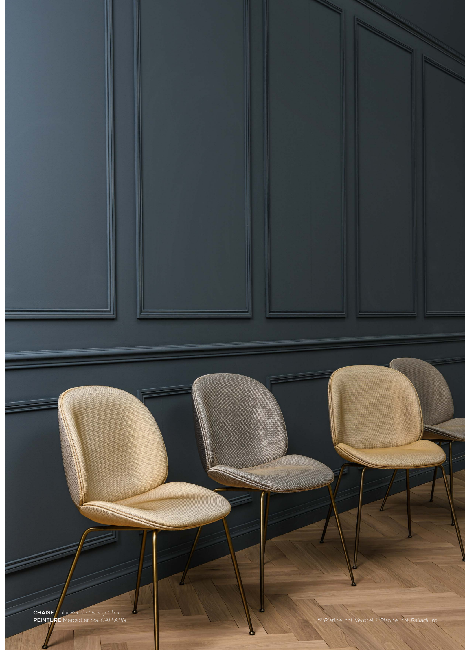
CHAISE Cubi Beetle Dining Chair PEINTURE Mercadier col. GALLATIN