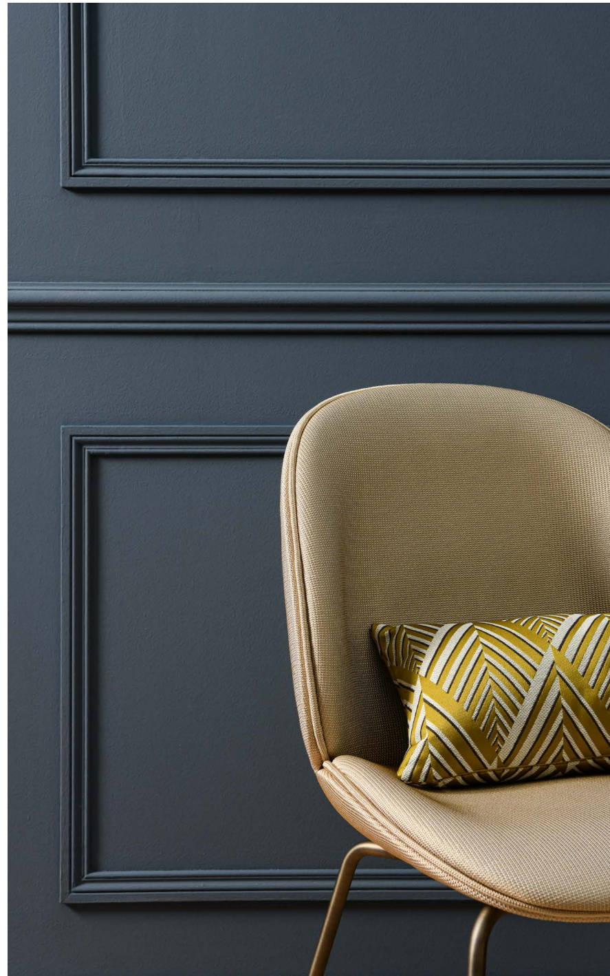
Coussin ® Ariane, col. Absinthe