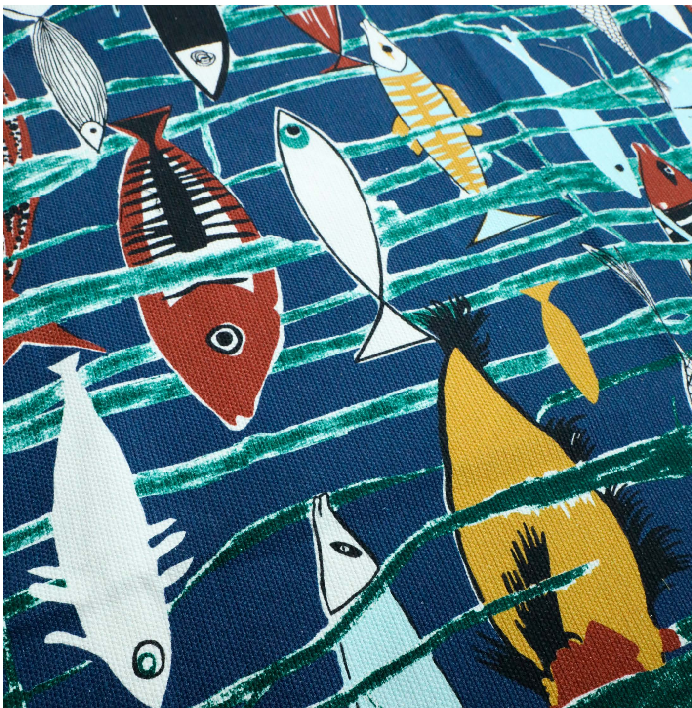
Lagon, col. marine