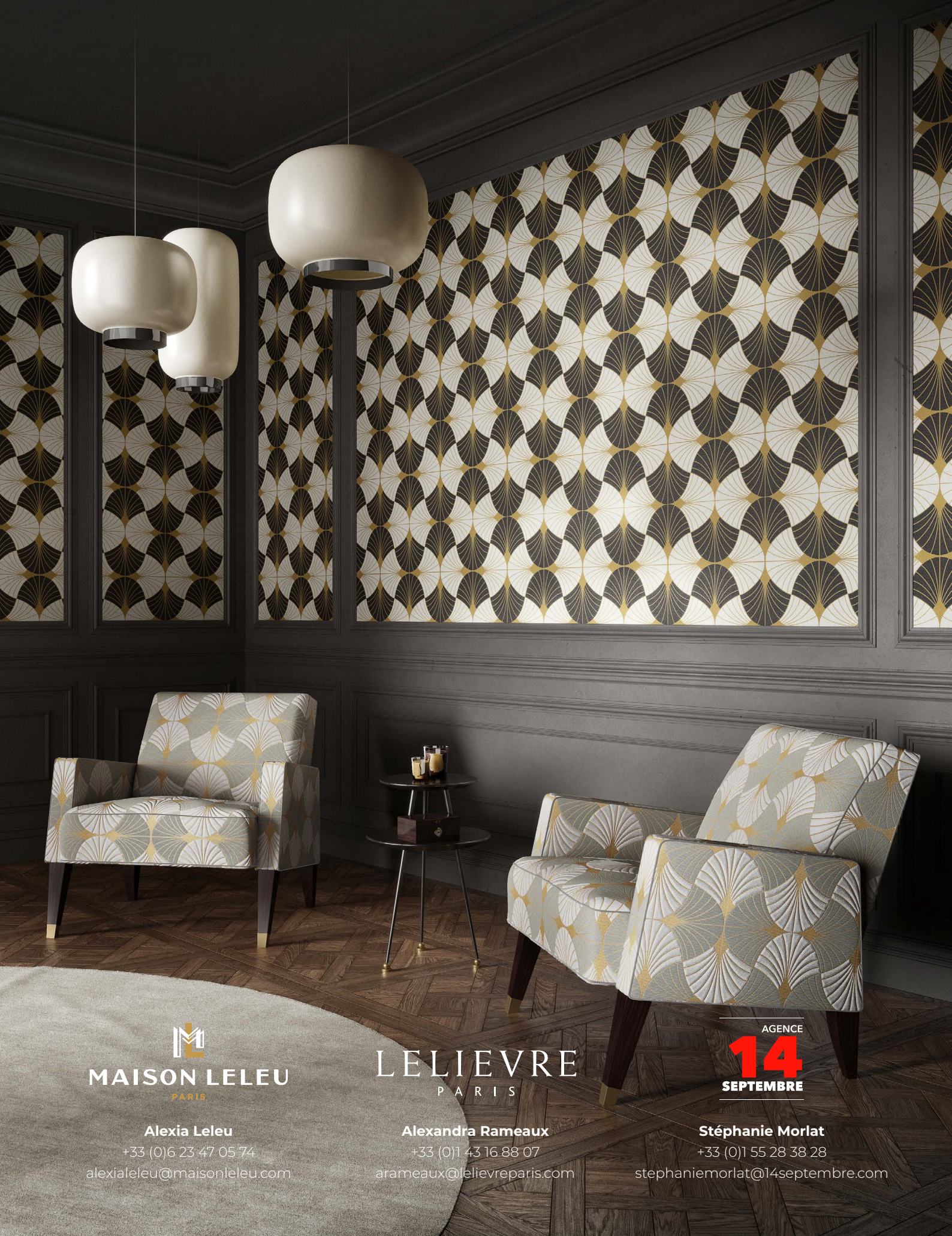
Table d'appoint, Margot , Maison Leleu Fauteuils, Pete , Maison Leleu

Papier peint, Gatsby , col. noir Tissu, Flabella , col. Vert de Gris