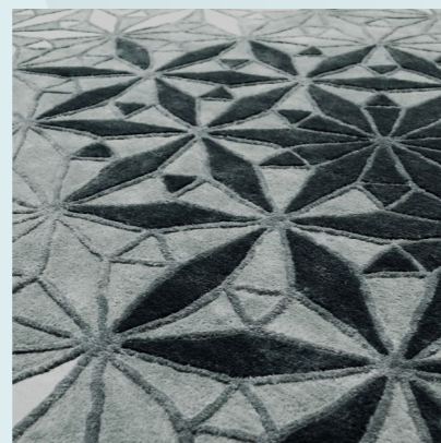
01 - ARDOISE